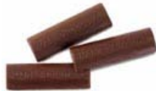
Chocolate en barras