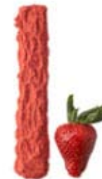
Polvo sabor a frutas