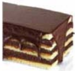
Tipo Ganache para relleno