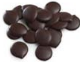
Chocolate tipo monedas