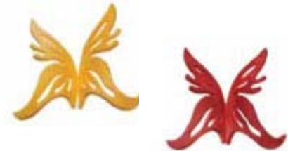
Luster Color Sprays