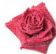
Flores y petalos cristalizados