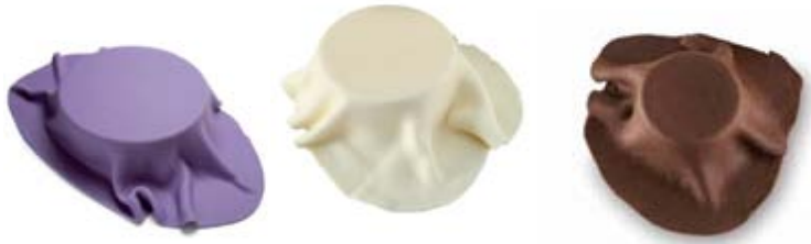
Masa Grischuna en diversos tonos