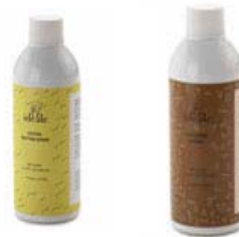
Colores en Spray