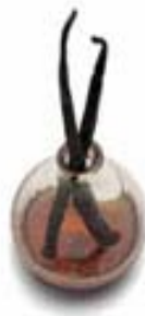
Vainilla y extractos de frutas