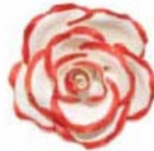
Luster Color Powder