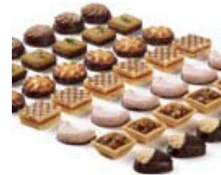
Mini pasteleria surtida