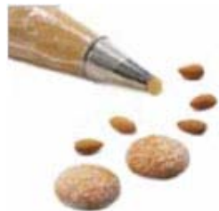
Productos a base de nueces