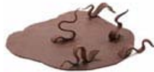
Modeling Paste Dark Chocolate