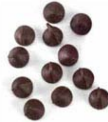
Chispas de chocolate