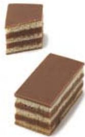
Mini pasteleria individual