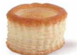
Voul au vent