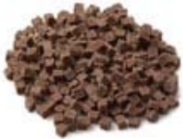
Chocolate en cubos