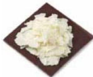
Chocolate en lajas