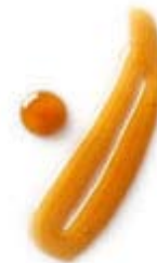
Salsas , purés, geles y mermeladas